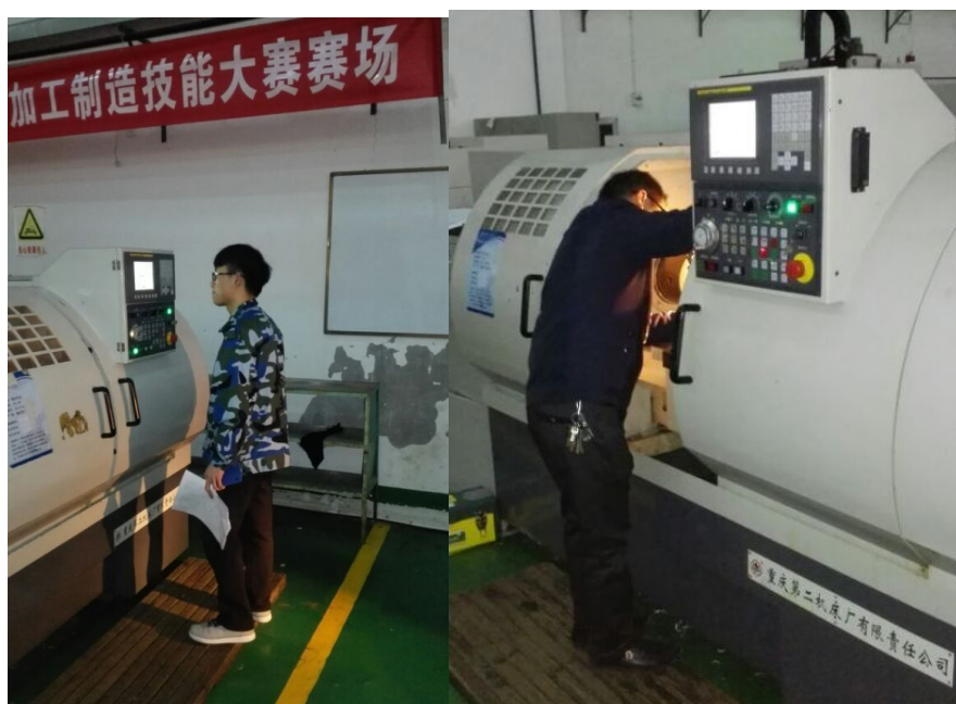
图为参赛选手在操作机床

3月27日至29日，贵阳市职业教育技能大赛加工制造类数控加工项目比赛在我院装备实训中心圆满进行，共有四所职业院校，师生共60人次参赛。经过三天的角逐，顺利完成数车、数铣、注塑模具CAD/CAE等8个项目比赛。