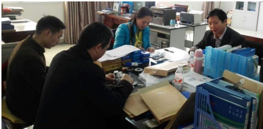
图为裁判组专家在为考生的大赛作品评分