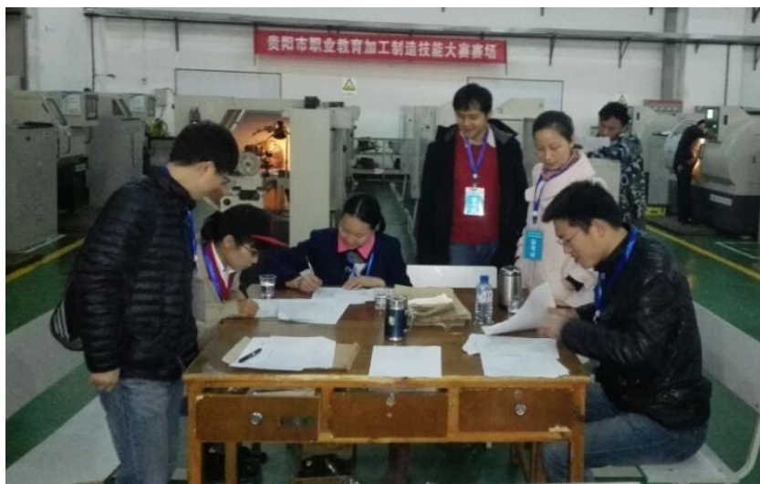
图为教师组考生在监考员的注视下答卷