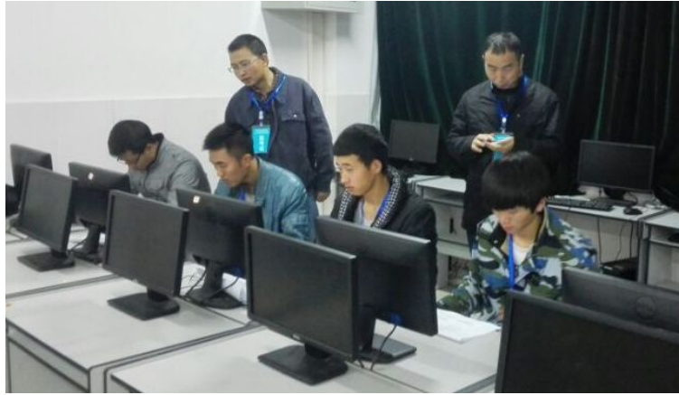
图为考生在考试机房绘制图形